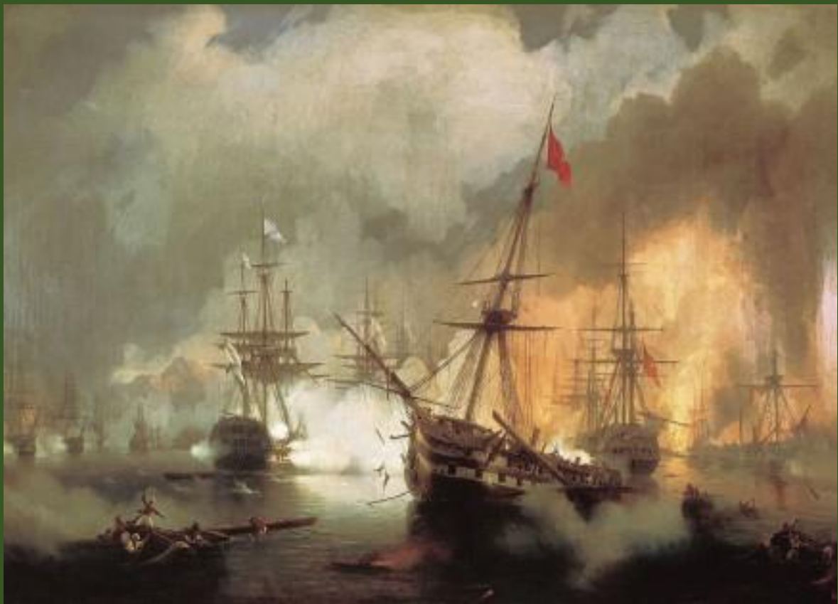
« Η Ναυμαχία του Ναβαρίνου » 1827- Ιβάν Αϊβαζόφκι