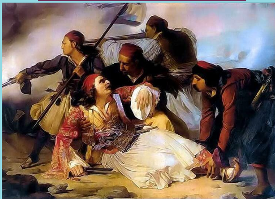
«Ο θάνατος του Μάρκου Μπότσαρη» (Λουδοβίκος Λιπαρίνι 1800 - 1856)