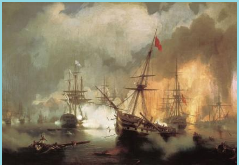
«Η Ναυμαχία του Ναβαρίνου» 1827- Ιβάν Αϊβαζόφ