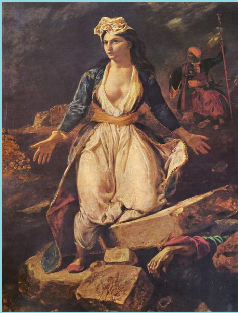
«'Η Ελλάδα στα ερείπια του Μεσολογγίου» 1826 Ευγένιος Ντελακρουά