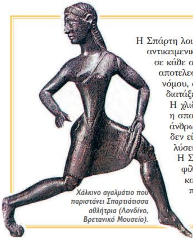
Χάλκινο αγαλμάτιο που παριστάνει Σπαρτιάτισσα αθλήτρια (Λονδίνο, Βρετανικό Μουσείο).